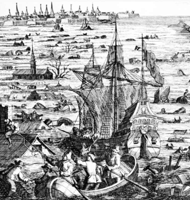
„Abbildung der fast übernatürlich-hohen Wasserflut am H. Christ-Tag 1717 ...“ - Unbekannt, Kupferstich, Detail